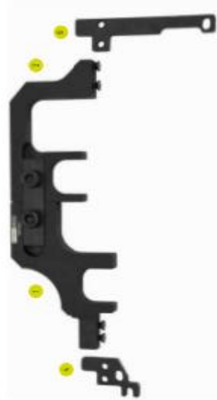
Variante 1: für BMW / Mini / PSA - N12, N16, EP3, EP6C, F16XHR (EP6F)