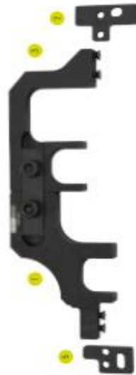
Variante 2: BMW / Mini / PSA / Opel - N13, N18, EP6, A16XHL, D16XHT (ab Bj. 2010), DGX