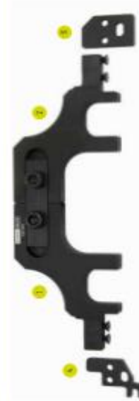
Variante 4: für PSA / Opel - EP6FDT, D16XHT (bis Bj. 2010)