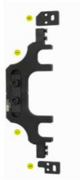
Variante 3: für BMW / Mini - N14